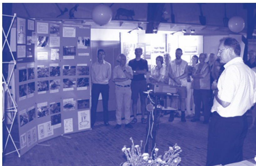
Veel belangstelling tijdens inloopavond in De Beken in september 2004

Om de herinrichting van het Beekdal mogelijk te maken moet de gemeente Renkum het bestemmingsplan aanpassen. Daarvoor zijn de eerste stappen gezet. Onlangs heeft een hoorzitting plaatsgevonden om de zienswijzen te horen van bezwaarders. Deze zienswijzen worden nu verwerkt. In de loop van het jaar zullen het college van B en W en de gemeenteraad een besluit nemen over het bestemmingsplan.